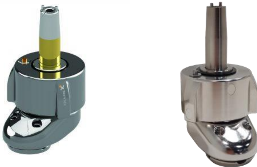
Foto van de nieuw aangekondigde Click Safety Adapter

De samenwerking tussen Xilloc en OTN heeft al geleid tot de ontwikkeling van een nieuwe, verbeterde versie van de Click Safety Adapter, wat maar weer bewijst dat er een echte "klik" is tussen beide bedrijven. Deze nieuwe versie zal binnenkort beschikbaar zijn. Momenteel is Xilloc aanwezig op de OT-World in Leipzig, de internationale vakbeurs en wereldcongres voor de laatste innovaties op het gebied van prothesen en orthoses, waar het deze nieuwe generatie Click Safety Adapters publiekelijk demonstreert.